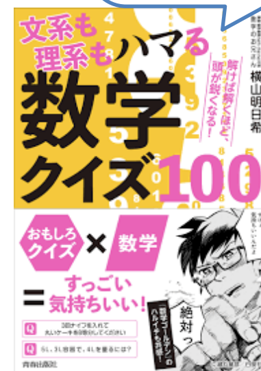
文系も理系もハマる数学クイズ100 より出題

こんな問題が100問詰まっている 「文系も理系もハマる数学クイズ 100」好評発売中です！